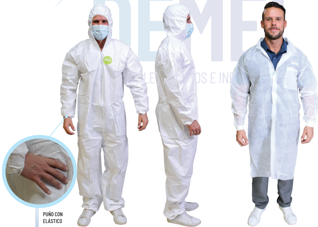
PUÑO CON ELÁSTICO